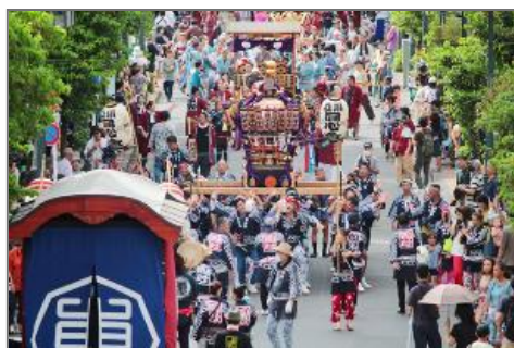
すわじんじや みこし だし しやしんていさつ たちかわいんまつしよ 諏訪神社の神輿・山車 (写真提供:立川印刷所)

しゅってん そうむしやう 出典:総務省ホームページ ( https://www.soumu.go.jp/main_sosiki/dajinkanbou/sensai/situation/state/kanto_21.html )