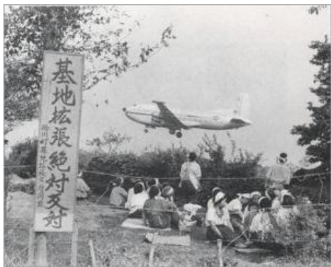
ねんごろ べいぐんたちかわ きち 1995年頃の米軍立川基地

近くの諏訪神社は木立が茂る中にあり夏はとても涼しくエアコンなどない時代ですから子供の頃いつもそこが遊び場でした。特に夏まつりは盛大で楽しみでした。お神輿や山車が出ます。顔におしろいを塗ってもらい、嬉しくて山車を引いた記憶も鮮明に残っています。そして木立の中におばけ屋敷や金魚すくい、屋台が立ちならび家と神社を何回も往復したことも覚えてます。神社のお祭りが最近では商工会も加わったお祭りとなり規模も大きくなったようですが、私の実家はすでになく今そこに行くこともありません。ノスタルジックな南口でしたが近年モノレールの駅が出来て周辺もガラリと変わりました。ふる里・立川の進化に驚いているこの頃です。