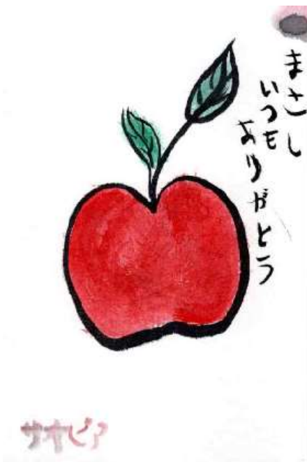
のむら 野村サオピア(カンボジア)