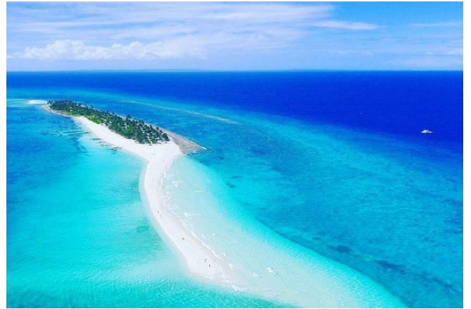
カラマンガマン島

かんこくや中国や日本からの旅行者は多いです。次はアメリカとヨーロッパからの旅行者です。ビーチがたくさんあり、一年中きこうがあたたかく、全国でインフラせいがすすみ、人々は英語ができるし、生活費が安い、退職した後フィリピンにすみたい外国人が多いです。皆さんがいつかフィリピンを訪れてくださることを願っています。どうもありがとうございました。