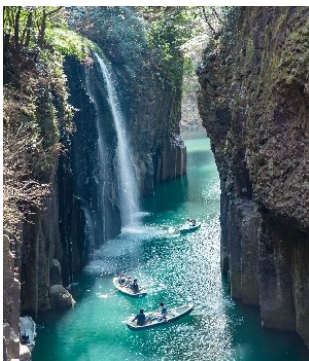
たかちほきょう 高千穂峡