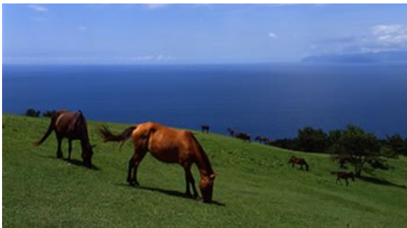
とよのみさき 都井岬