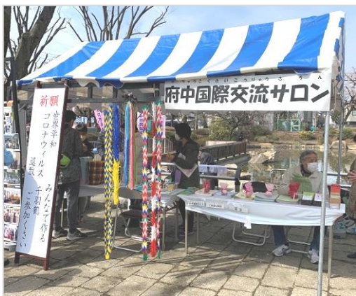
府中国際交流サロンの出展ブース

2日目は朝から雨模様で、参加者の出足も鈍く、午後からは本降りになり、午後2時頃にはブースを撤収しました。(編集部)