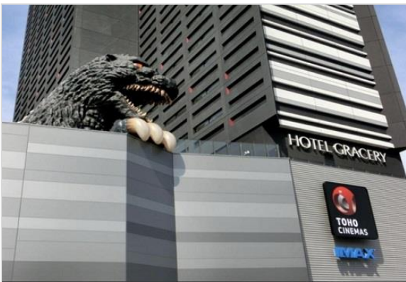
ホテルの屋上のゴジラ模型

18日(金)に桜井病院に行き、PCR検査と抗原検査をしたところ、抗原検査で陽性となり、この先どう するかなどの案内書をもって帰ってきました。21日(月)にPCR検査の結果でも陽性となったので、案内書に 従って保健所に連絡をしたところ、翌日22日(火)にタクシーが迎えにきてくれました。その後も う一人男性患者を迎えに行き、新宿のホテルグレイスリー新宿に行きました。そのホテルの屋上には大 きなゴジラの模型があり、若者に人気のスポットだ とのことでした。