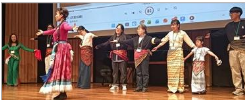
チベットの民族舞踊