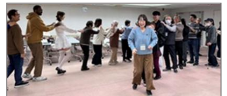
じゃんけんゲーム

しかし、今回遊んだじゃんけんは、中国でよく知っている遊び方とは少し違っていました。二人ずつでじゃんけんをして、負けた人が勝者の後ろに並んでいきます。その後も別のグループと続けて対戦し、最後の一人が決まるま