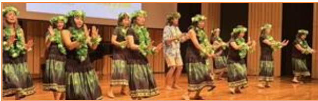
ダンスチームのフラダンス

ボルテージが最高潮に達したところで、AKB48のヒット曲『365日の紙飛行機』をバックにステージの上下で参加者の大多数が乱舞。「いや楽しいね」という声があちらこちらから。2度踊った後、参加者のほぼ全員がステージの上下に集まり、記念写真を撮って、府中国際交流サロン30周年記念の集いは大盛り上がりの中でフィナーレとなった。