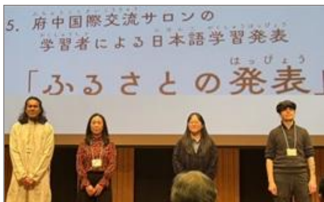
「ふるさとの発表」の司会と発表者