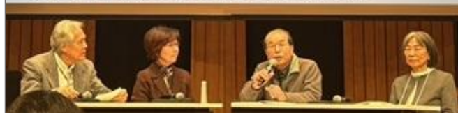
日本語学習会ボランティアによる体験談トーク