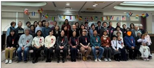
発表者、司会者、そしてサポーターのボランティアの方々

言うまでもなく、この発表会は「コンクール」ではありません。発表者ひとりひとりが今現在の自分の日本語能力に応じて、準備し練習し発表し、その経験をとおして日本語を学ぶことの難しさや楽しさをあらためて知ること。そしてそれが今後の日本語学習の励みになり、日本人との交流も深まれば、というのがこの会の趣旨ではないでしょうか。この有意義な会が未永く続いていくことを心から願いながら会場を後にしました。